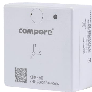
图 4. 智能温振传感器外形图