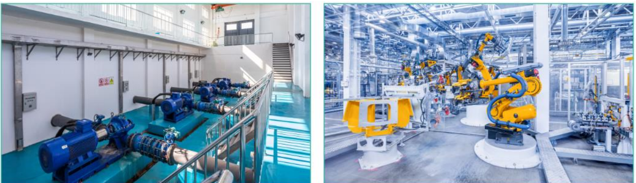
图 3. 设备现场图

告别疲于奔命式的加班抢修，降低企业员工的劳动强度，有效减少人力成本，提高企业智能化、信息化管理水平