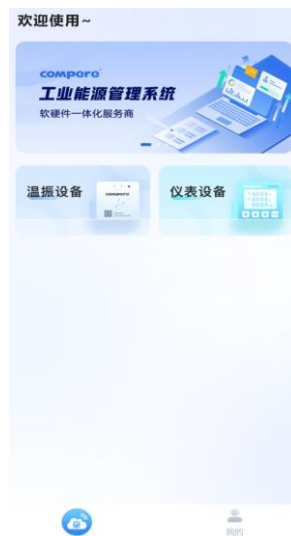
图 11. 配置选择界面

第二步：双击传感器右侧的触摸键，传感器的指示灯变成橙色快速闪烁的状态，点击温振设备，进入列表。