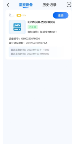
图 12. 温振设备列表和历史记录