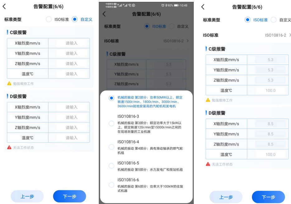
图 19. 向导模式的告警配置界面

第十步：告警配置，用于设置告警的限值，分为 ISO 标准和自定义两种方式。ISO 标准是依据电机的参数与标准匹配，自定义是客户根据自己的经验，给旋转类设备设置的合理告警限值。由于旋转类设备的型号比较多，安装方式不尽相同，采用自定义的方法，需要具备旋转类设备运行的丰富经验。