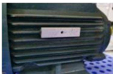
图 6. 铝卡安装图