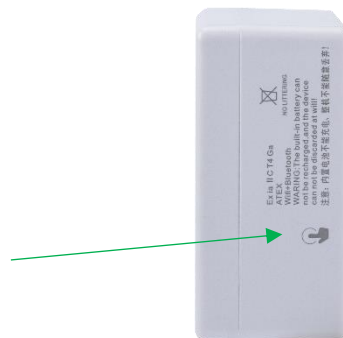
图 5. 智能温振传感器侧面图