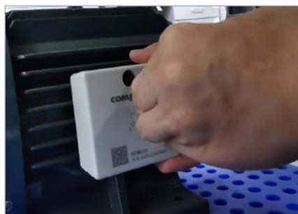
图 9. 智能温振传感器平底固定图