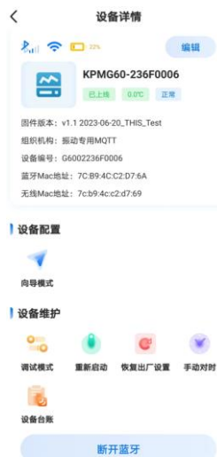
图 13. 温振传感器配置界面

第五步：点击向导模式，进行 WiFi 配置，配置本地的 WiFi 名称，WiFi 连接的密码。（需要注意传感器用的是 2.4G 的 WiFi。）