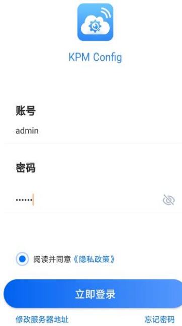
图 10. 配置 APP 登录界面

第二步：双击传感器右侧的触摸键，传感器的指示灯变成橙色快速闪烁的状态，点击温振设备，进入列表。