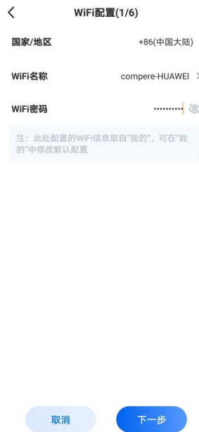
图 14. 向导模式的 WiFi 配置界面

第六步：MQTT 配置，需要配置连接平台的地址和端口号，用户名和密码与平台登录一致，用于 APP 安全登录。客户端 ID 和主题是传感器蓝牙传输的，可以手动修改。（如果传感器传的平台非我公司配套的系统，需要提前开发测试，测试成功后，才可以进行 MQTT 配置。）