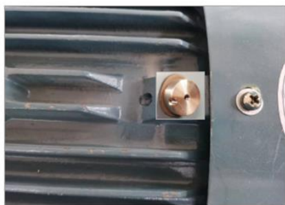
图 8. 平底安装图