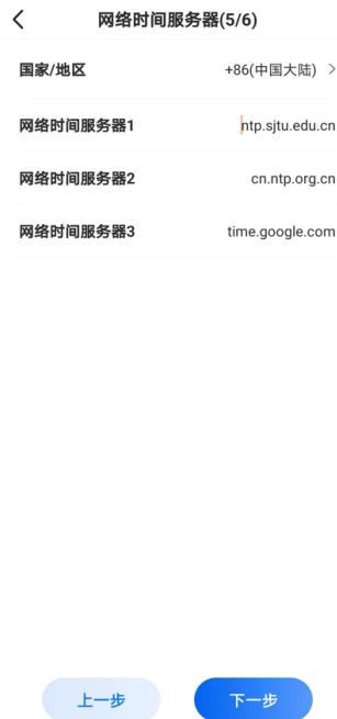
图 18. 向导模式的 NTP 时间服务器配置界面

第十步：告警配置，用于设置告警的限值，分为 ISO 标准和自定义两种方式。ISO 标准是依据电机的参数与标准匹配，自定义是客户根据自己的经验，给旋转类设备设置的合理告警限值。由于旋转类设备的型号比较多，安装方式不尽相同，采用自定义的方法，需要具备旋转类设备运行的丰富经验。