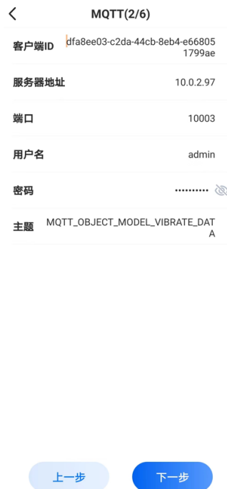
图 15. 向导模式的 MQTT 配置界面

第六步：MQTT 配置，需要配置连接平台的地址和端口号，用户名和密码与平台登录一致，用于 APP 安全登录。客户端 ID 和主题是传感器蓝牙传输的，可以手动修改。（如果传感器传的平台非我公司配套的系统，需要提前开发测试，测试成功后，才可以进行 MQTT 配置。）